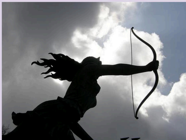
Fontana di Diana, di L. Mastrolorenzi, Nemi

Far conoscere il territorio di Nemi, la sua poesia e la sua bellezza, anche a coloro che non hanno ancora avuto la possibilità di farlo, è l'intento dell'Associazione Aeneas Onlus.